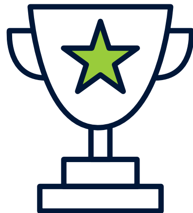
ISG Star of Excellence

O endereço de e-mail é: ISG.star@isg-one.com