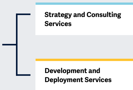
Ilustração simplificada

O estudo oferece insights de tendências de mercado em desenvolvimento e dinâmicas competitivas entre fornecedores de soluções de GenAI.